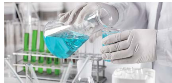
Сточные воды предприятий химического производства