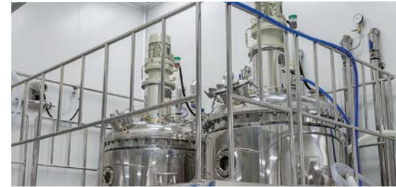
Производственные сточные воды гидролизно-дрожжевых и гидролизно-спиртовых заводов

Нами были разработаны специализированные программы обучения по отраслям промышленности, прохождение которых позволит персоналу предприятий эффективно эксплуатировать очистные сооружения.