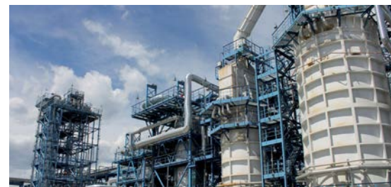
Сточные воды нефтеперерабатывающих заводов, нефтепромыслов и нефтебаз