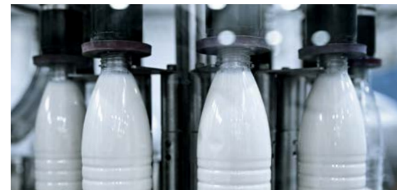
Сточные воды предприятий молочной промышленности