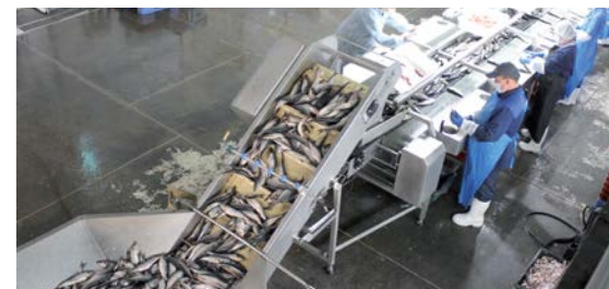
Сточные воды предприятий рыбной промышленности