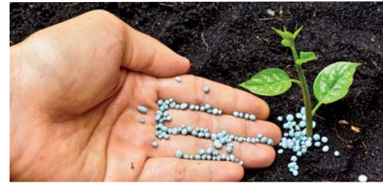
Сточные воды предприятий и перевалочных баз минеральных удобрений