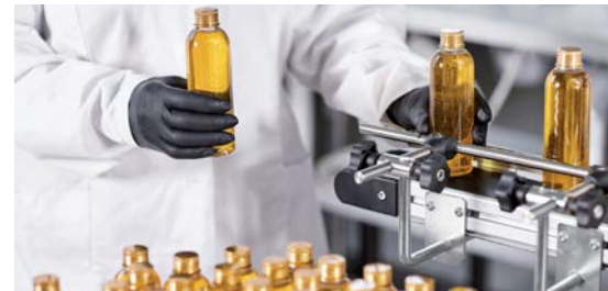
Сточные воды маслоэкстракционных предприятий