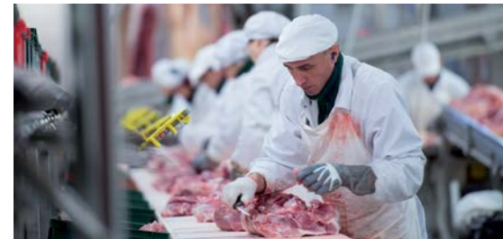
Сточные воды предприятий мясной промышленности